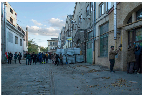
Jelenet: a forradalmárokat veszélyeztető nő kivégzése

A videós stáb különösen aktív részvétele azért is volt indokolt, mert nem pusztán a szereplőket, illetve helyzeteiket kellett képen és hangban rögzíteni, hanem legalább ennyire fontos volt a nézők szerepe is, ami alapos előkészítő munkát és a felvételek során különös gondosságot igényelt. Nagyon fontos volt az összhang megteremtése az operatőr