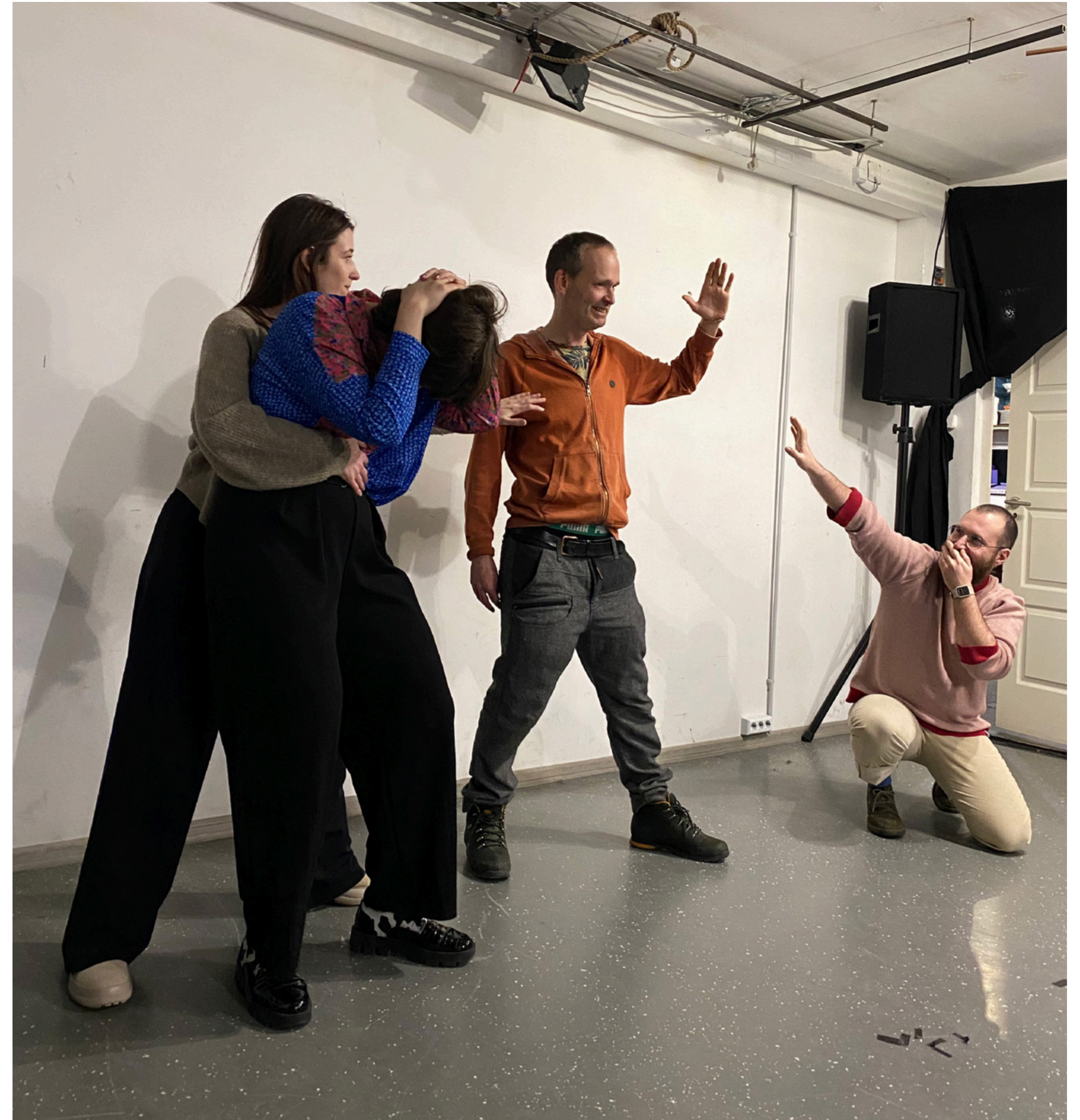
Participanți la workshop creând o imagine cu conflict

Al treilea joc se numește Exercițiu Orb . Acest joc a fost inventat de Augusto Boal și este folosit în pregătirea unui spectacol de teatru forum. Prin etapele jocului, participanții învață să aibă încredere unul în celălalt și să preia rolul de lider. La final, ei învață să aibă încredere în ei înșiși. Efectul pozitiv al exercițiului este că participanții învață să aibă empatie față de persoanele cu dizabilități vizuale, deoarece experimentează ce înseamnă să nu vezi. Un alt efect pozitiv este că participanții realizează că pot fi împuterniciți chiar și atunci când își pierd unul dintre simțuri, deoarece ajung să-și folosească celelalte simțuri existente și sunt stimulați să se implice într-un mod creativ cu ei înșiși și cu mediul înconjurător.