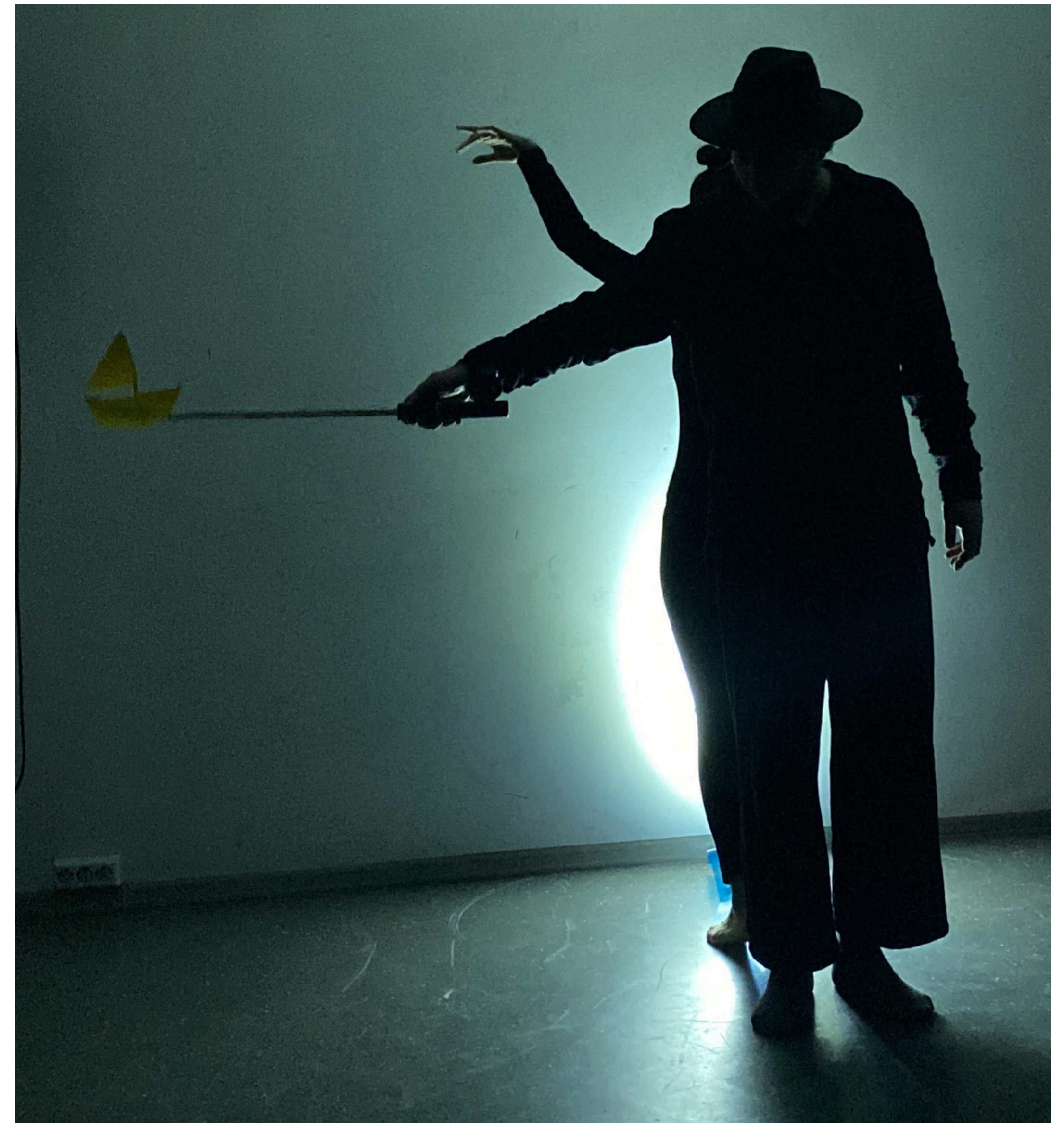
Folosirea luminii în scenă

Al treilea exercițiu a aprofundat metoda teatrului-forum, pornind de la propunerea fiecărui participant de a crea o imagine. Ei au trebuit să creeze o imagine cu un conflict, cu trei personaje diferite: Agresorul, Victima și Martorul. După ce fiecare grup și-a prezentat imaginea, am discutat despre conflict, am identificat personajele și am exemplificat moduri în care o scenă poate fi dezvoltată dintr-o anumită imagine, prin improvizație.