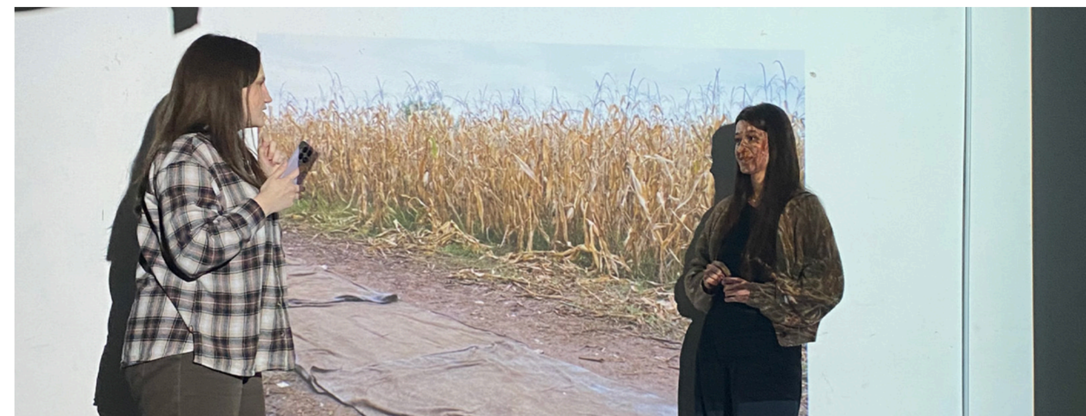
Cum se poate folosi un proiector într-un spectacol