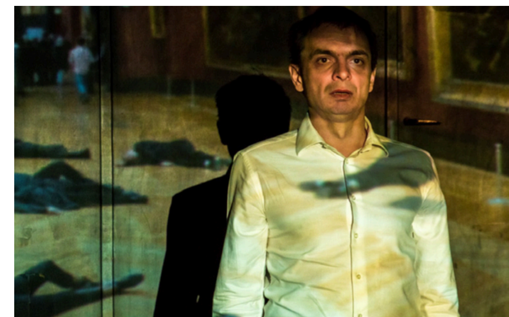
Înmormântare la Teresienburg

Poate fi folosită ca mijloc de creare a unei atmosfere („ Gulliver ”), dar și ca modalitate de proiectare a unui spațiu concret („ Înmormântare la Teresienburg ”). Acest spectacol - „ Scrisori de la Marginea Pădurii ” este un exemplu de joc cu proiectoare analogice și a fost ales deoarece un astfel de exemplu se regăsea printre proiectele prezentate în cadrul atelierului.