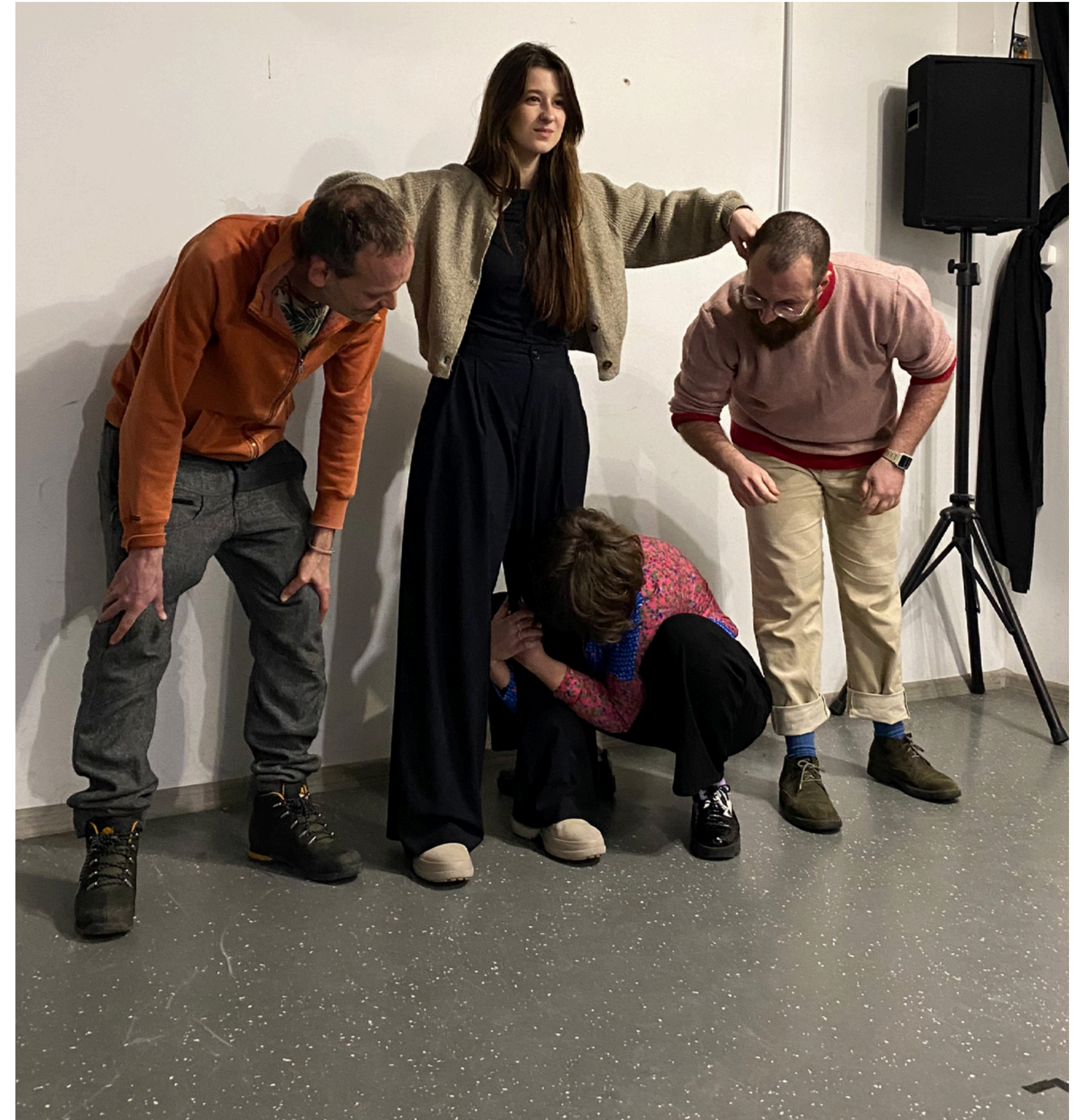
Participanți la workshop creând o imagine cu conflict

Al treilea exercițiu a aprofundat metoda teatrului forum, pornind de la propunerea fiecărui participant de a crea o imagine. Ei au trebuit să creeze o imagine cu un conflict, cu trei personaje diferite: agresorul, victima și martorul. După ce fiecare grup și-a prezentat imaginea, am discutat despre conflict, am identificat personajele și am exemplificat moduri în care o scenă poate fi dezvoltată dintr-o anumită imagine, prin improvizație.